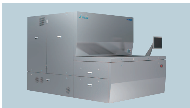
Ledia (マニュアル露光タイプ)