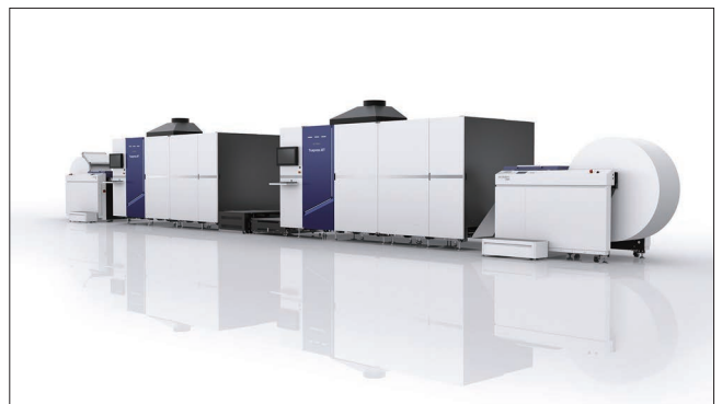
Truepress JET 560HDX

不確実性が非常に高まった現代では、印刷業界を取り巻く環境も刻一刻と変化し、さまざまな形で新たな価値創造が求められています。SCREEN GAは、80年間にわたって製版・印刷のプロフェッショナルとして、これまで革新的な製品を生み出し、世界中をお客さまと共に彩ってきました。81年目となる2024年、SCREEN GAは新たな一歩として、デジタル印刷機とオフセット印刷機が、より高い次元で融合する新たな印刷の未来をお客さまと共に描き出します。「drupa 2024」では「Creating A Future In Print ～Tech x Irodori～」をテーマに、印刷の未来を共に創造できるご提案を行います。商業・出版印刷市場に向けては、さらなる印刷の革新を促す新製品、高速連帳デジタル印刷機「Truepress JET 560HDX」の実機を展示します。新たに開発したインクジェットヘッド機構と、オフセットコート紙に表面処理なしで印刷可能な高濃度インク「Truepress ink SC2」を組み合わせることで、より高精細な印刷品質を実現しました。また、新構造の高効率ドライヤーユニットの搭載と最大560mmの用紙幅への対応により、生産性を大幅に向上させることにも成功しました。印刷サンプルを通じて、お客さまのビジネスに新たな可能性をもたらす品質をご体感ください。さらに、「Truepressシリーズ」で蓄積した豊富な稼働実績の経験を継承・進化させた新たなオペレーションシステムを搭載。長年培ったデジタル製版のノウハウを基に、ハードウェアとソフトウェアを高い次元で融合させ、オペレーターが日々の印刷現場で直面する問題を解決します。当社ブースで、この最新のデジタルインクジェット印刷機をぜひご覧ください。その他にも、モノクロ出版物の印刷やDMの追い刷りに適したモノクロ高速連帳デジタル印刷機「Truepress JET 520HD mono」と高濃度な新インクの組み合わせによる、ライブデモを実施します。新インクの重厚感のある黒と、小さな文字においてもシャープな視認性を、印刷サンプルでご確認いただけます。