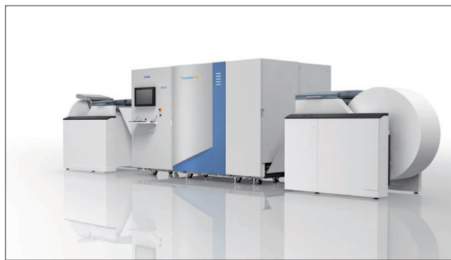
Truepress PAC 520P