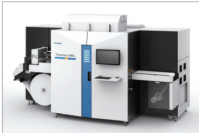
Truepress LABEL 350UV SAI S

URL: www.screeneurope.com/ja/screen-drupa-24-jp/