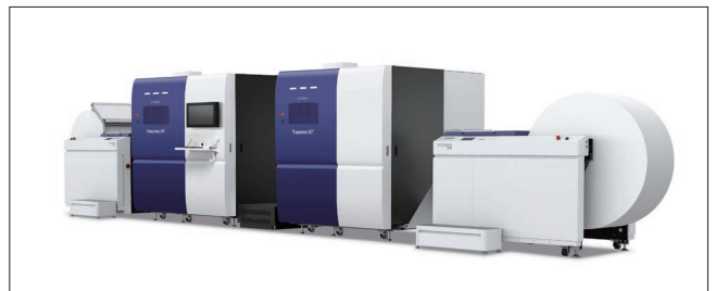
Truepress JET 520HD mono

さらに、新製品である「Truepress JET S320」の実機も展示。小ロットのオンデマンドブックソリューション、バリアブルDMソリューション、在庫を極力削減するため必要なときに必要な部数だけを印刷する最適生産ソリューションなど、サステナブルな社会を実現する各種ソリューションをご提案します。併せて、累計2万5千台を超える出荷実績を誇る「PlateRiteシリーズ」の最新モデルである、8ページサイズCTP「PlateRite HD 8900NII」の実機を展示します。データ入稿・製版から印刷までの工程を支えるSCREEN GAだからこそ可能な、印刷仕様や部数に応じたアナログ印刷機とデジタル印刷機のハイブリッドソリューションをご紹介します。