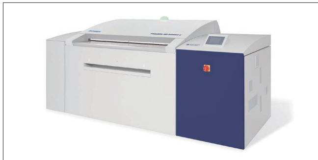
PlateRite HD 8900NII

ラベル・パッケージ印刷市場に向けては、新開発のデジタルブライマーユニットを搭載したラベル向けUVインクジェット印刷機「Truepress LABEL 350UV SAI S」と、食品包材に求められる規制に準拠した水性インクを搭載した紙包装向けインクジェット印刷機「Truepress PAC 520P」を実演展示します。環境配慮基材を使ったラベルや紙包装パッケージのサンプルによるサステナブルソリューション、デジタルインクジェット印刷による小ロット・中ロット生産が実現する生産性向上ソリューションなどの、地球環境負担低減に貢献する印刷ビジネスモデルをご提案します。また、軟包装向けインクジェット印刷機「Truepress PAC 830F」の装置ユニットの一部を展示し、軟包装デジタル印刷テクノロジーや食品安全規格に準拠した水性インク、デバイスの特長をご紹介します。さらに、CGS ORIS社のカラーマネジメント技術を生かした協業ソリューションも出展。SCREEN GAが考える未来のソリューションを、ぜひ会場でご体感ください。