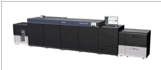
Truepress JET S320